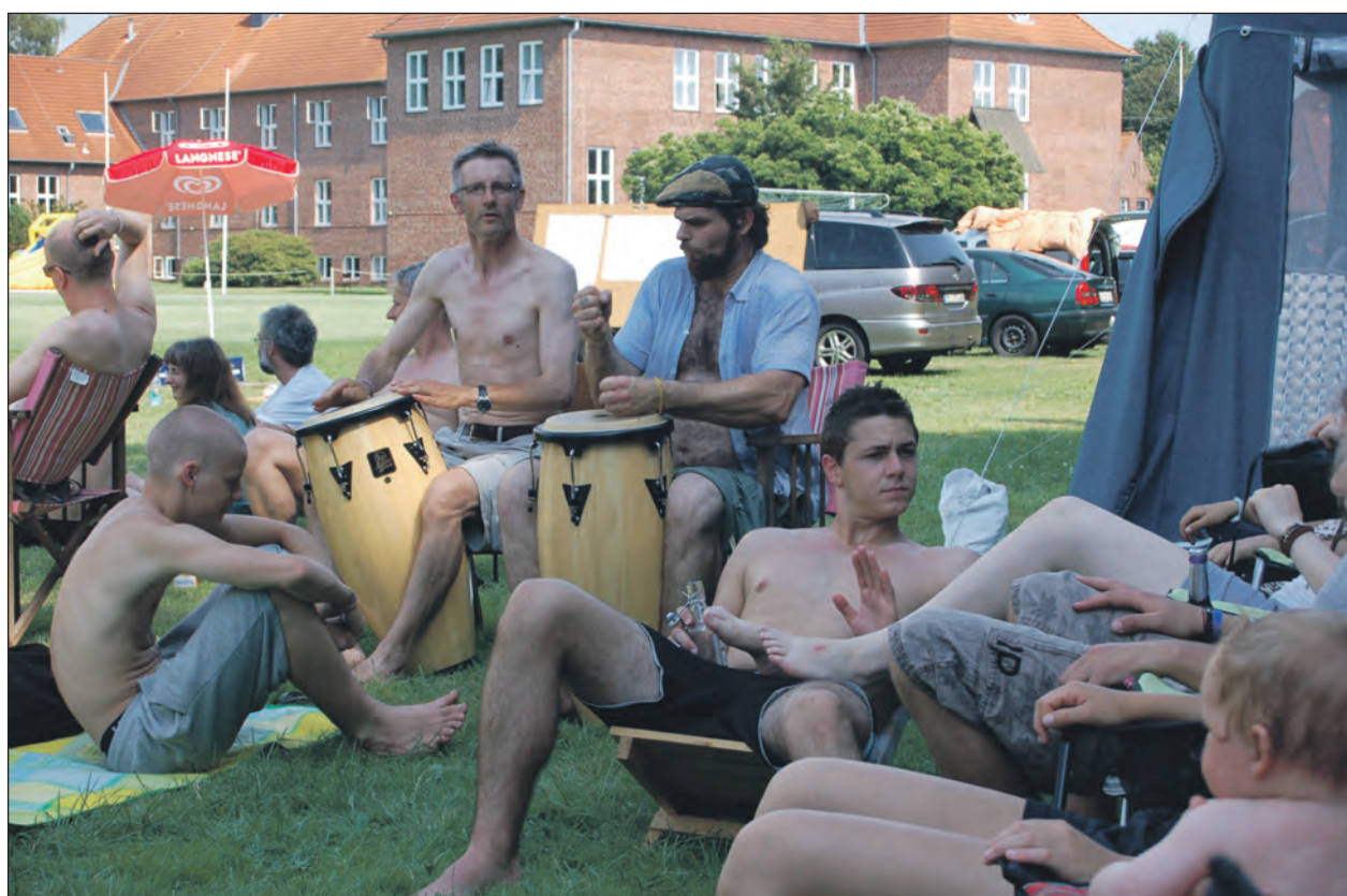
Karibiske trommer og hyggestemning på Sommerhøjskolen

Der har også været andre år, da der blev diskuteret en del, fordi de unge