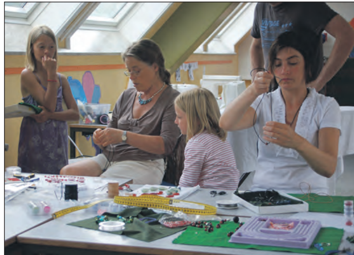
Her blev der produceret alle slags smykker.