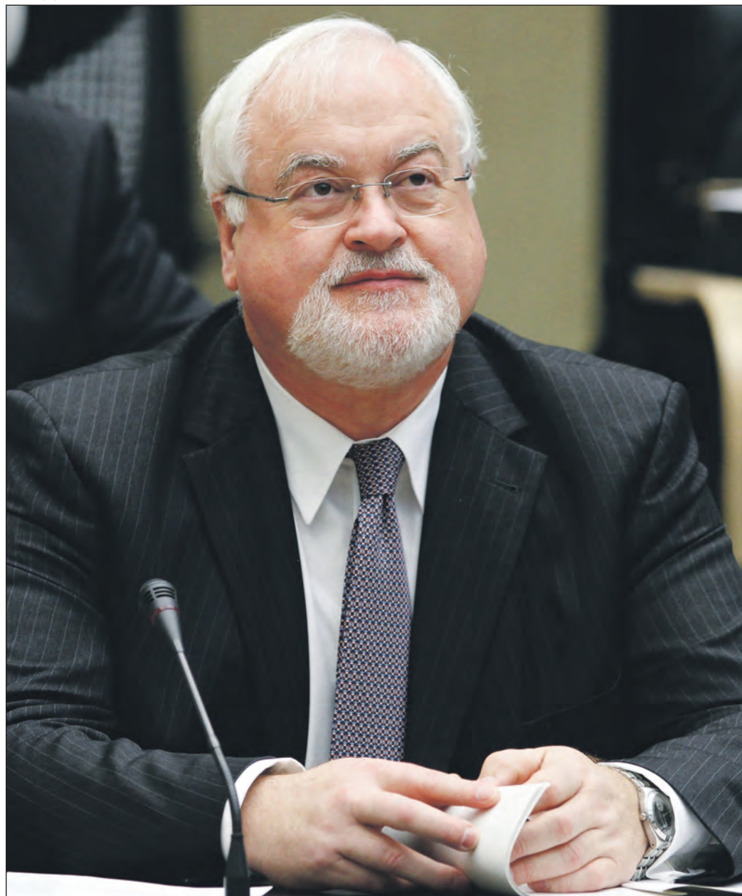
Regeringschef Peter Harry Carstensen (CDU) er overrasket over de voldsomme reaktioner, de planlagte nedskæringer over for mindretalsskolerne har affødt.