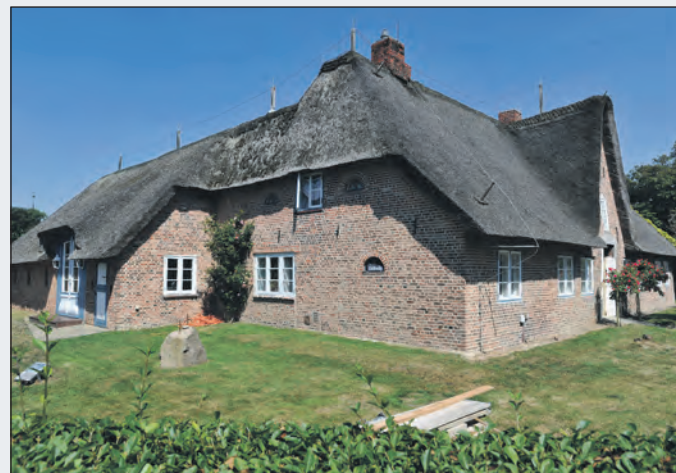
Den gamle friserigård i Vesterland skal sættes i stand for 50.000 euro.