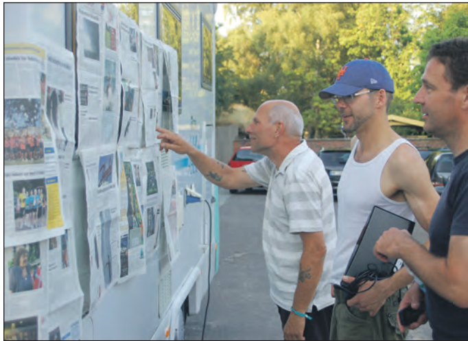
Flensborg Avis var et flittig læst medium på sommerhøjskolen.