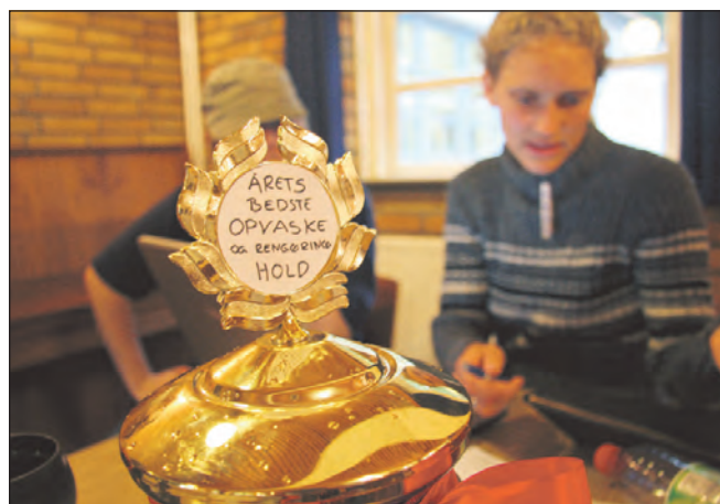
Siden planlægningsgruppen har valgt at give det bedste rengøringshold en vandrepokal, er der gået sport i rengøringen

- Godt 70 procent er gengangere, siger Stinne, så vi kender hinanden.